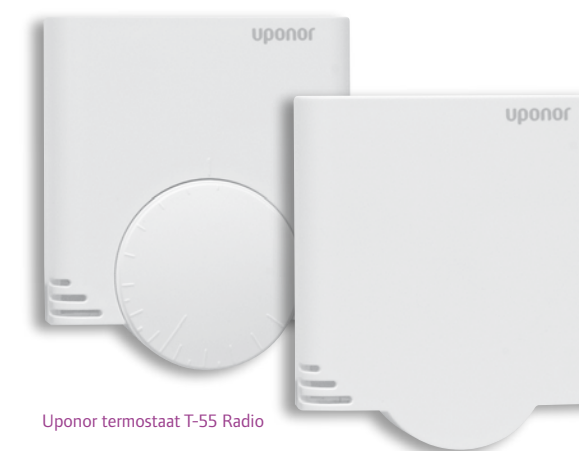
Uponor termostaat T-55 Radio