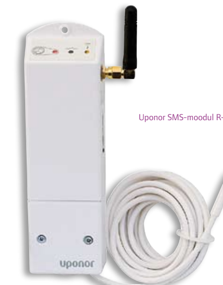
Uponor SMS-moodul R-56

See termostaat on mõeldud kasutamiseks avalikes ruumides. Reguleerimislüüti on varjatud kaanega, mis tuleb temperatuuri seadmiseks eemaldada. Termostaadi signaal väljub vaid siis, kui kaas on avatud. Miinimum- ja maksimumtemperatuuri määramiseks või välistemperatuuri kuvamiseks võib Uponor termostaadi T-54 ühendada välissensoritega. Termostaati T-54 on vaja ka juhul, kui soovitakse kasutada kaugjuhtimist Uponor SMS-mooduli kaudu.