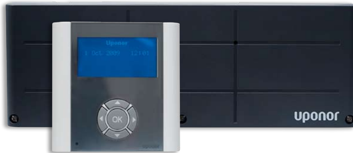
Juhtmevaba kontrolleri ja dünaamilise energijahtimisega juhtpaneeli komplekt

Integreeritud DEM-funktsioonid pakuvad põrandkütte- ja jahutussüsteemide puhul optimaalset energijaotust. Suureneb nii energiasääst kui ka inimese mugavustunne.