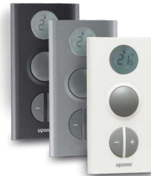
Uponor ekraaniga termostaat T-75 Radio

Termostaat näitab ruumi- või seadistustemperatuuri. Temperatuuri muutmiseks on vaja kasutada vaid esipaneeli pluss- ja miinusnuppu. Termostaadi sensor arvestab ruumi õhutemperatuuri ning ümbritsevate pindade ja teiste küttekehade soojuskiirgust.